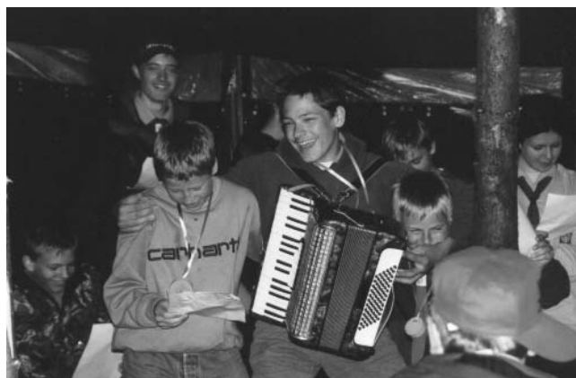
Nur knapp geschlagen: Die Titelverteidiger im Liederwettbewerb, die Siedlung Zugvögel Rehau am diesjährigen Pfingstlager

Spatzen als Wölflinge aufzunehmen. Danach kehrten wir zum Lagerplatz zurück und ließen den Abend mit Liedern und Tschai ausklingen. Am nächsten Morgen nach dem Frühstück, machten wir uns gleich daran die Kohten und Jurte abzubauen und das Gepäck