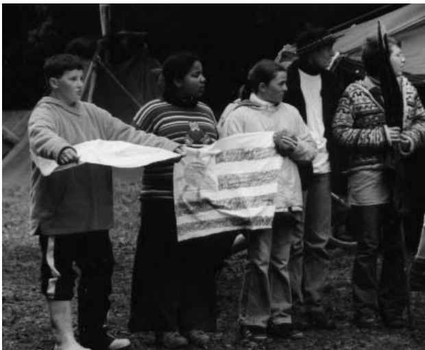
Nochmal Schlachtenbummler: Hier die Sportler aus Guatemala, mit ihrer wiedergefundenen Fahne