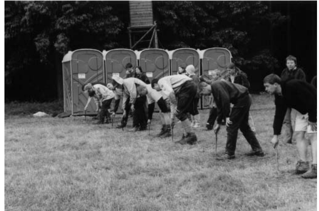
Wettkämpfe: hier in der Gigantenklasse, der Klasse über 65 kg. Da mussten selbst die schwersten und größten Sippenführer ran. Noch sind sie nicht gestartet: 100 m Lauf am Pfingstlager

und Früchten > heiß) der musste erst beschworen werden denn in so einem